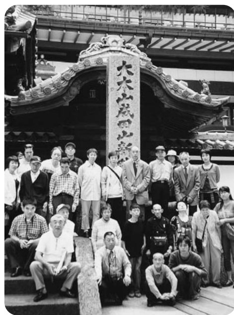
成田山新勝寺にて。さて御利益のほどは如何に？

帰りのバスの中では、旅行が終わってしまうことを残念がる声が聞かれ、楽しく有意義な旅行であったことを感じました。